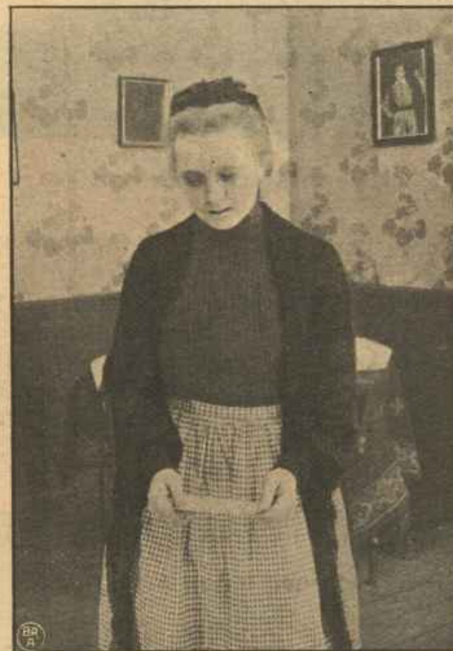
Pengesedlen, som hendes egen Dreng gav hende!

Og Fabrikantens Hustru forstaar straks, at nu skal omsider