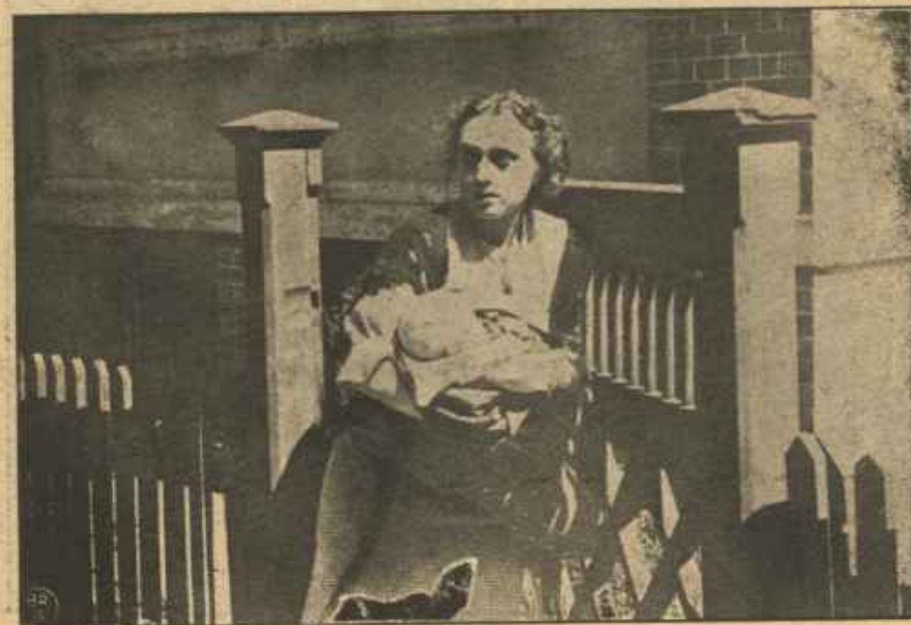
„Hvad om jeg betroede mit Barn i deres Varetægt!“

Hans fattige Moder er bleven ældet og graa, men slider stadig i sit Strygeri. Og sit Barn følger hun stadig — paa Afstand.