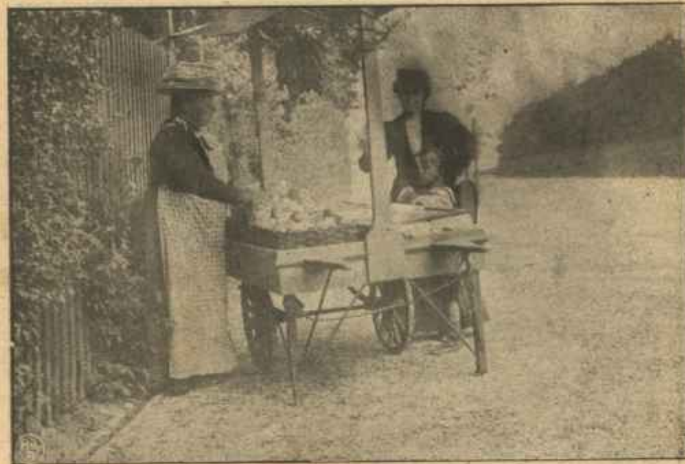
Da Drengen var 6 Aar gammel.

Hendes første Tanke er at gemme Pengesedlen. Men saa faar hun en Idé: Den unge Dame er jo altsaa aabenbart for-