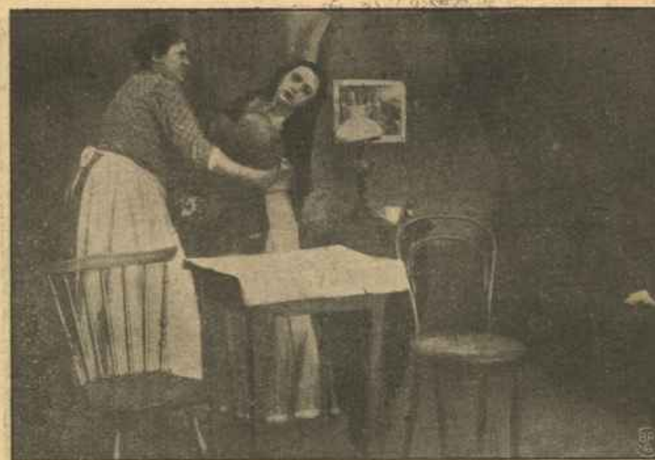
Smidt paa Gaden.

Da den unge Frue vil gaa op af Trappen, støder hun Foden mod en Bylt. Hvad er det? Hun bøjer sig ned. Et Barn, en lille forladt og hjælpeløs Dreng! Varsomt løfter hun Barnet op, læser den lille Papirslap og rækker den dybt rørt til sin Mand. „Skal vi beholde ham som Erstatning for den, vi mistede?“ Hendes Mand ser sig om i Haven, som for at finde en Løsning paa Gaaden. Men der er ingen — alt er stille. Saa bøjer han samtykkende Hovedet, og den unge Frue bærer det lille Hittebarn ind.