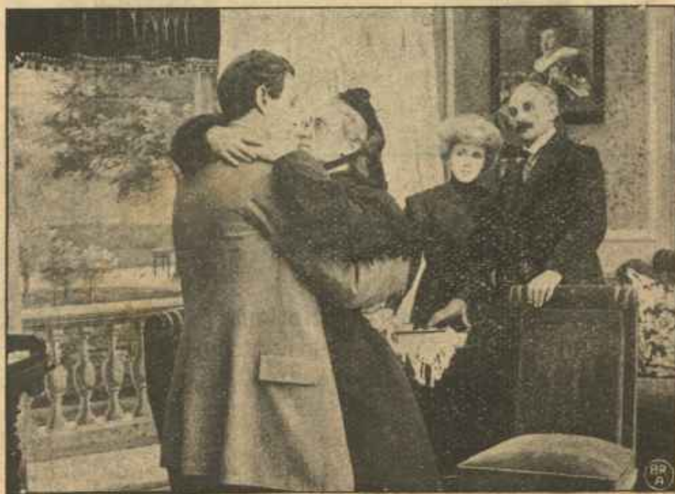
Moder og Søn genfinder hinanden.

Saaledes finder Sønnen sin rigtige Moder, og Moderen sin elskede Dreng. Med straalende Glans i sine taarevædede Øjne, slynger hun sine Arme om hans Hals, og hun viser ham, hvorledes Verset, han bar fæstet til sit Bryst, den Gang hun forlod ham, passer ind i det forrevne Blad af den gamle Salmebog.