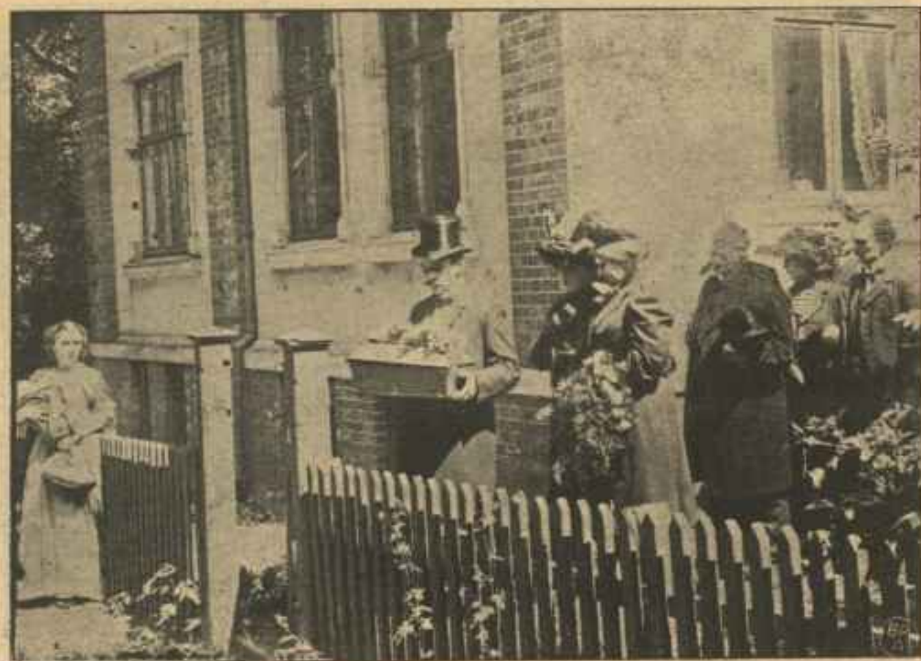
En Sorgens Dag i Fabrikantens Hjem.

De smaa Fyre vender Lommerne, men nej, der er ingen!